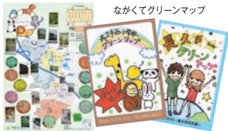
ながくてグリーンマップ

当社もこの「思い」を形にたく、描いていたいただいたかわいいイラストや手書きの地図を活かすことで、「思い」が見ていた方に「伝わる」ようデザイン・印刷をさせていただきます。