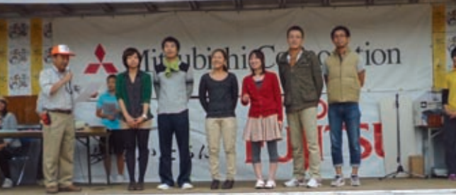
わがチーム “南山・丸和ブッチョーズ”