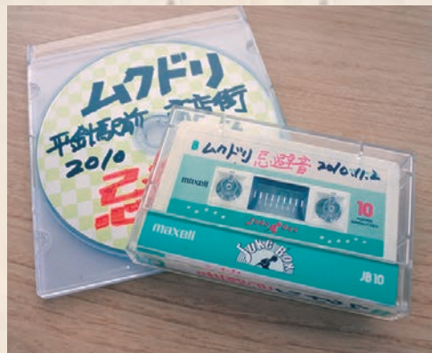
▲忌避音(ムクドリが危険を感じたときの鳴き声)の音源

深刻な被害を受けた平針駅前商店街は、早急な対策を迫られた。当時、先に被害を受けていた市内の別地区に尋ねたところ、ロケット花火の打ち上げが効果ありとの情報を得た。しかし平針には広い空き地がない。行政に確認したが、絶対ダメとの返答で、断念せざるを得なかった。県外はどうかと調