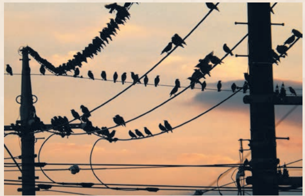
▲電線にとまるムクドリの群れ

てしまう。近辺の土地開発に伴い、従来の住みかを失った為と思われる。夕刻になると空を覆いつくすほどの数が飛来し、歩道は糞まみれ、ギャーという耳障りな声が響きわたるホラー映画『鳥』さながらの異様な光景が広がった。