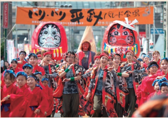
▲ につぼんど真ん中祭りバリ・バリ平針パレード

それまで降って湧いたようなムクドリと、必要に駆られて闘ってきたものの、これって商店街がやることか?という疑問や、ネガティブなニュースで有名になってしまい、悔しい思いがあった。本当はど真ん中祭りのパレード開催など、明るい話題のある街なのに……。